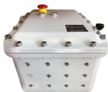
Quadro elettrico in acciaio verniciato ambienti ATEX