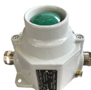
Pulsante tipo "apri" in acciaio verniciato ambienti ATEX