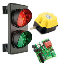
Scopri altri accessori ↗