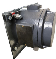
Debimetro per il regolare controllo del flusso d'aria